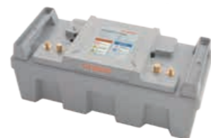
Power accu 24-3500