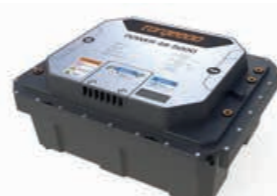
Power accu 48-5000